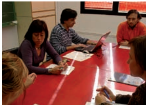
Membres del claustre de professors.

El passat mes de gener la Junta de l'AMPA i els membres de la Direcció d'aquest Institut ens vam reunir per parlar de temes d'interès per la bona marxa del centre. La comunicació entre la Junta Directiva de l'AMPA, la direcció i els membres del claustre de professors i professores es molt fluida i ambdues parts volem aprofitar les possibles sinèrgies per tirar endavant iniciatives conjuntes i millorar diferents aspectes del nostre centre. Tot i que els pares no hem d'interferir en la tasca del professorat i de la direcció, els membres de la Junta de l'AMPA creiem que podem i hem de recolzar la seva feina d'educadors. L'AMPA aposta per tenir un projecte comú i implicar-se en l'educació dels nostres fills i filles, analitzar conjuntament els processos pedagògics, la qualitat del mateixos i les necessitats dels nois i noies. Considerem que aquestes reunions periòdiques poden ser molt profitoses per a tractar temes d'interès per tots nosaltres i de projecció de l'IES Alella.